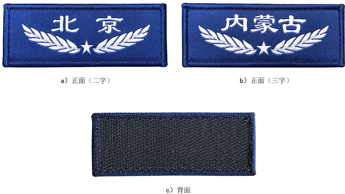
图 1 丝织胸徽样式结构

4.4.2 丝织胸徽颜色应符合标样；批产品颜色与标样相比，色差不低于 4-5 级。